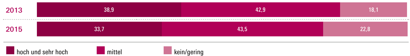
ABBILDUNG 1: Einschätzung der Kommunen zum Entwicklungsbedarf im Bereich „Ehrenamtsstrukturen und in diese Strukturen eingebundene Ehrenamtliche im Kontext Frühe Hilfen“

2014 (N=553).