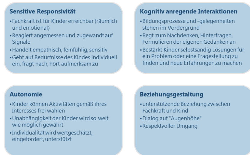
Abbildung 3: Definitionen von Sensitiver Responsivität, Kognitiv anregenden Interaktionen, Autonomie und Beziehungsgestaltung entsprechend des MS-Kita Kategorienhandbuchs

Parallel zu diesen Bewertungen der Filmsequenzen wurden ebenso die Ergebnisse des KES-RZ Ratings analysiert und in Bezug zu den anderen Datenquellen gesetzt (3.-4.).