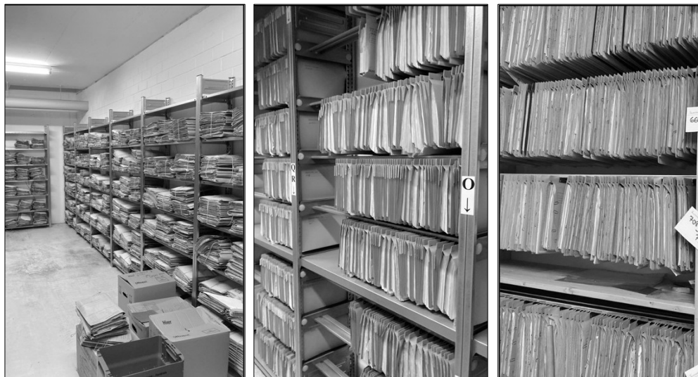
Sachgebiet Vormundschaften / Münchner Waisenhaus / Münchner Kindl-Heim.

Der im Kooperationsvertrag festgelegte Untersuchungszeitraum von 1945 bis 1990 wurde hierfür in drei Teile untergliedert (1945–1960, 1961–1975, 1976–1990). Für jeden dieser drei Zeiträume wurde eine Zufallsziehung von insgesamt 200 Heimakten vorgesehen. Damit sollte das Sample aus allen drei städtischen Heimen insgesamt 600 Akten umfassen.