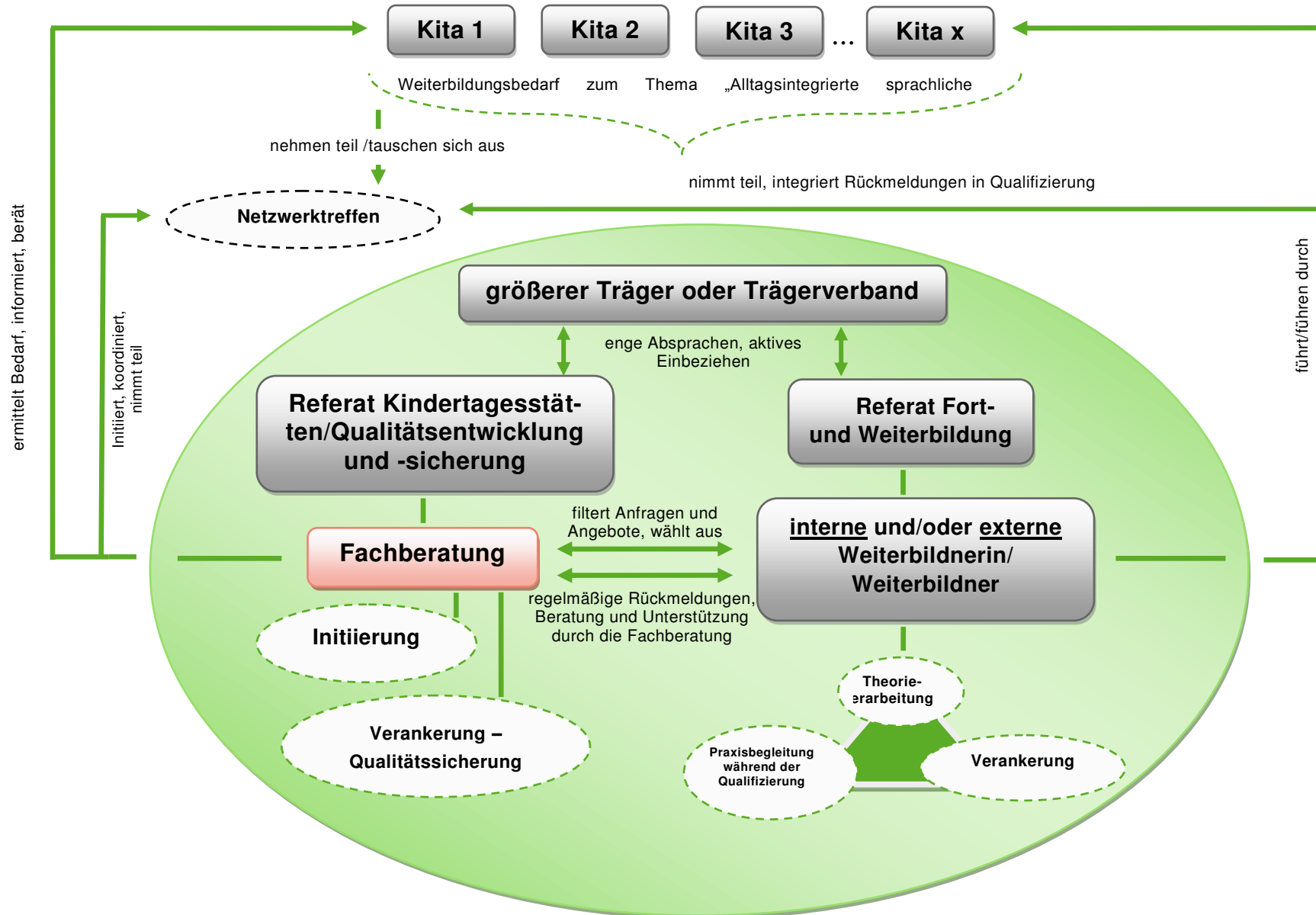
Schaubild 3: Modell C - Qualifizierung im Verbund