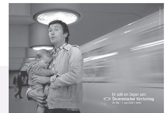
»Ihr sollt ein Segen sein.« Plakat, Ökumenischer Kirchentag 2003, Berlin